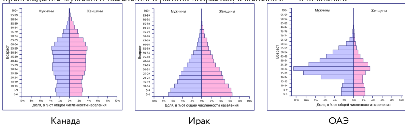
рисунок 2. - Половозрастные пирамиды

Для пирамиды развивающихся стран ( второй тип воспроизводства ), напротив, характерно очень широкое основание и узкий верх. Соотношение мужчин и женщин (левая и правая стороны пирамиды) не имеет столь существенных различий, однако заметно преобладание мужского населения в ранних возрастах, а женского — в пожилых.