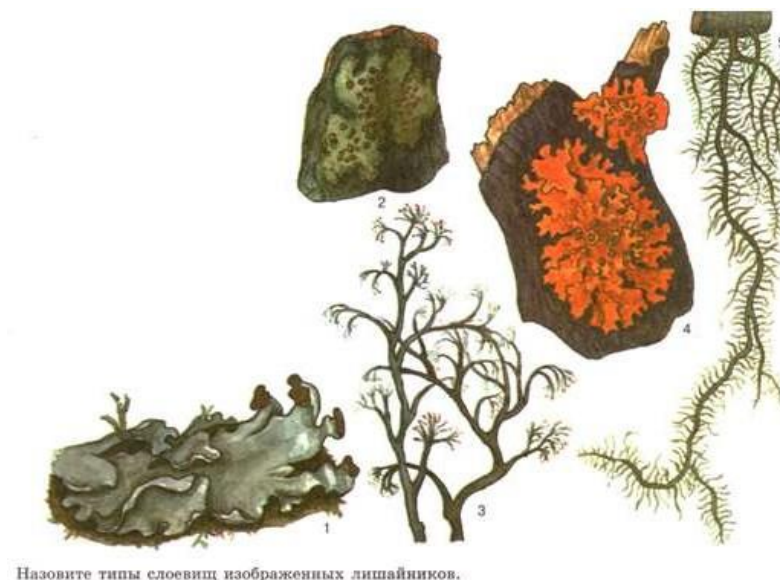
Назовите типы слоевищ изображенных лишайников.