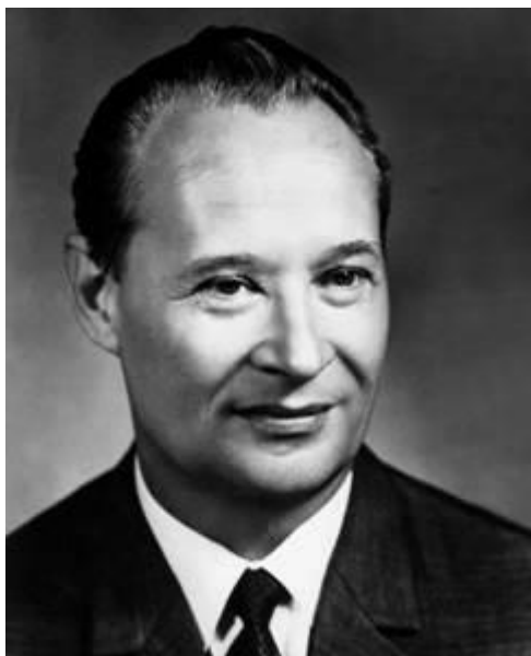
Рис. 8. Александр Дубчек – лидер Чешской коммунистической партии

Также Пражская весна привела к кризису в Польше в конце 1970-х гг., с которым поляки справились самостоятельно. В середине 1980-х гг. в отношениях СССР и Румынии, Югославии возникают кризисные моменты. Не все страны социалистического лагеря были готовы следовать в русле советской внутренней и внешней политики, что было основной причиной кризисов.