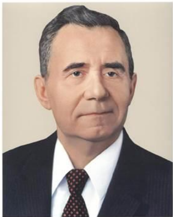
Андрей Андреевич ГРОМЫКО

Внешнюю политику СССР в 1964–1985 гг. определяли: во-первых, А.А. Громыко (Рис. 1) – министр иностранных дел СССР; во-вторых, Л.И. Брежнев (Рис. 2) – Генеральный секретарь ЦК КПСС СССР. Эти люди были не единственными, кто определял внешнюю политику государства, но от них зависело очень многое.