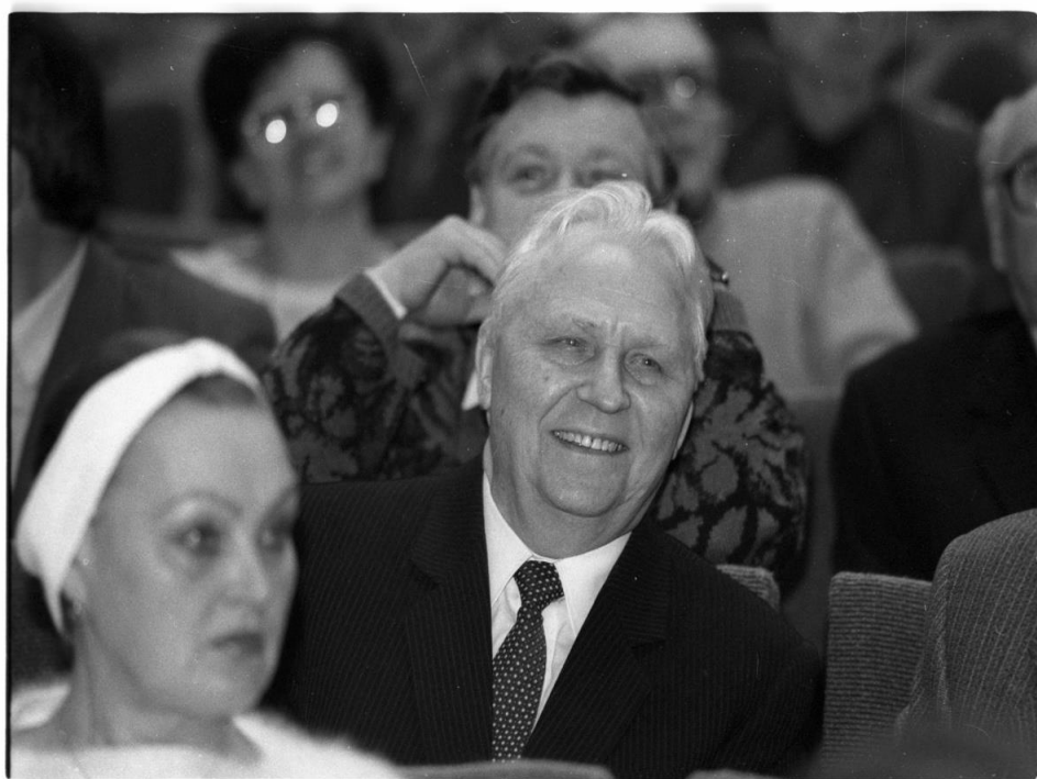
Рис. 5. Е.К. Лигачёв