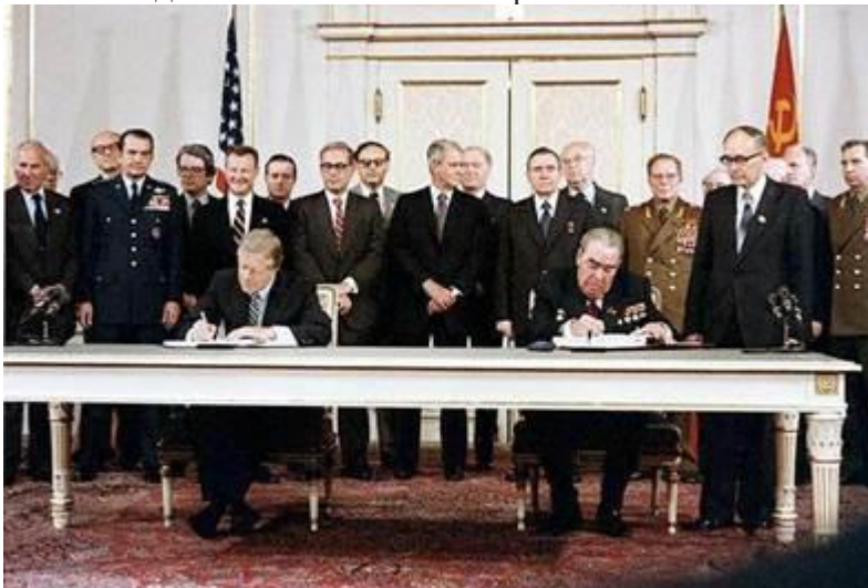
Рис. 4. Подписание ОСВ-2 Л.И. Брежневым и Дж. Картером

Главным документом времени разрядки стал Заключительный акт совещания о безопасности и сотрудничестве в Европе, подписанный в г. Хельсинки в 1975 г. всеми европейскими странами, СССР, США и Канадой (Хельсинские соглашения) (Рис. 5). В этом договоре впервые после окончания Второй мировой войны были заложены международные принципы, по которым жила и сейчас живёт Европа: нерушимость государственных границ, неприменение силы стран в отношении друг друга, решение конфликтов мирным дипломатическим путём, невмешательство государств во внутренние дела друг друга, суверенность государств, соблюдение и уважение прав своих граждан, а также граждан других государств, уважение и соблюдение прав человека. Значение Хельсинских соглашений было в том, что