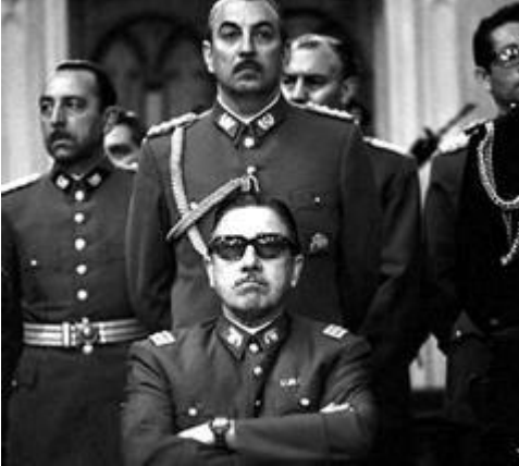
Рис. 11. А. Пиночет – диктатор Чили

Большая часть авторитета СССР в странах третьего мира рухнула в декабре 1979 г., когда СССР ввёл войска в Афганистан. Причиной этого шага советского государства являлось то, что руководство страны опасалось, что на южных границах СССР в условиях холодной войны окажутся американцы. Дипломатически ввод советских войск в Афганистан не был оформлен. Х. Амин (Рис. 11), афганский диктатор, был свергнут и убит в первые же часы советского вторжения, и в столице утвердился у власти советский ставленник Кармаль. Установить контроль над большей частью территории страны не удалось ни ему, ни советским интервентам, но Афганистан всё же остался социалистическим государством. Таким образом, афганский кризис стал симптомом того, что внешняя политика СССР 1980-х гг. претерпевала тяжёлое и кризисное состояние.