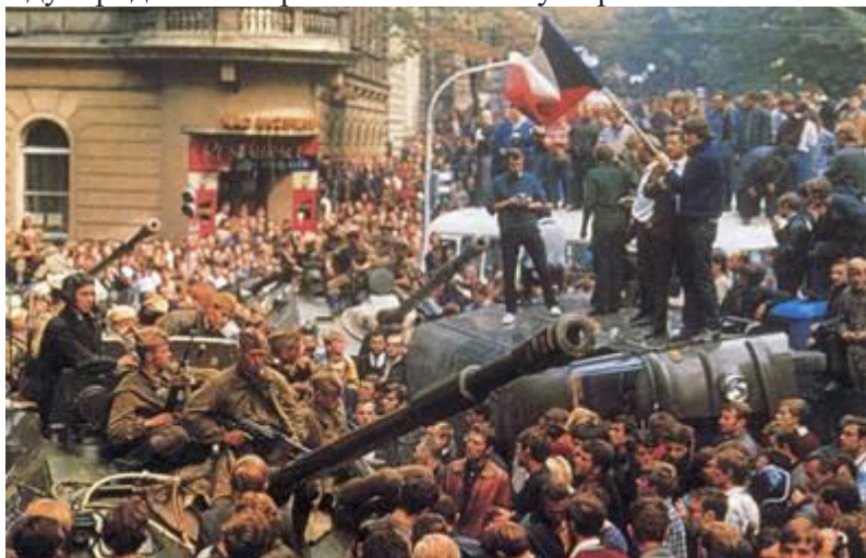
Рис. 7. Пражская весна 1968 г.

Первым значимым внешнеполитическим событием стала т.н. Пражская весна 1968 г. (Рис. 7), когда руководство Чешской коммунистической партии во главе с А. Дубчеком (Рис. 8) начало демократические реформы. Они проходили под лозунгом «Давайте построим социализм с человеческим лицом». Эти реформы заключались в том, что народу давалось больше свобод, меньше стало давление партии и т.д., но ничего радикального в стране не происходило. Но опасение СССР потерять Чехословакию как союзника и социалистическую страну присутствовало. В августе 1968 г. войска стран Организации Варшавского Договора были введены в Чехословакию. Со стороны Чехословакии эти действия были восприняты как агрессия против независимого государства. Эти события отрицательно сказались на международном авторитете СССР. Ему перестали во многом доверять союзники.