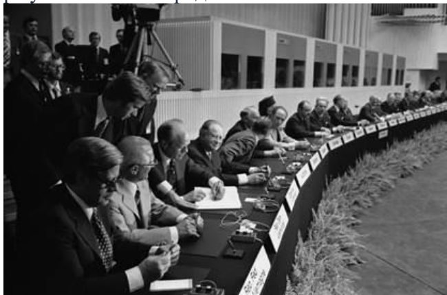
Рис. 5. Обсуждение Хельсинских соглашений

мировая общественность перестала беспокоиться и переживать по поводу возможной ядерной войны, и в мире установился порядок.