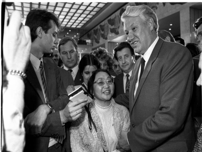
Рис. 4. Б.Н. Ельцин