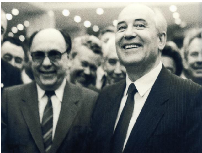
Рис. 7. Александр Николаевич Яковлев и Михаил Сергеевич Горбачев

Горбачёв был для своей должности сравнительно молодым человеком, мог говорить без бумажки, чувствовал себя раскованно среди толпы. Наконец, он сам пошёл в народ, что по тем временам стало настоящей сенсацией. Вместе с тем чувствовалось, что новому генсеку не просто даются первые месяцы работы. Это невольно прорывалось в его словах: «Кто не настроен перестраиваться, должен уйти, не мешать». Люди догадывались, что далеко не все наверху солидарны с Горбачёвым. Это вызывало к нему симпатии, делало его общественную поддержку исключительно широкой.