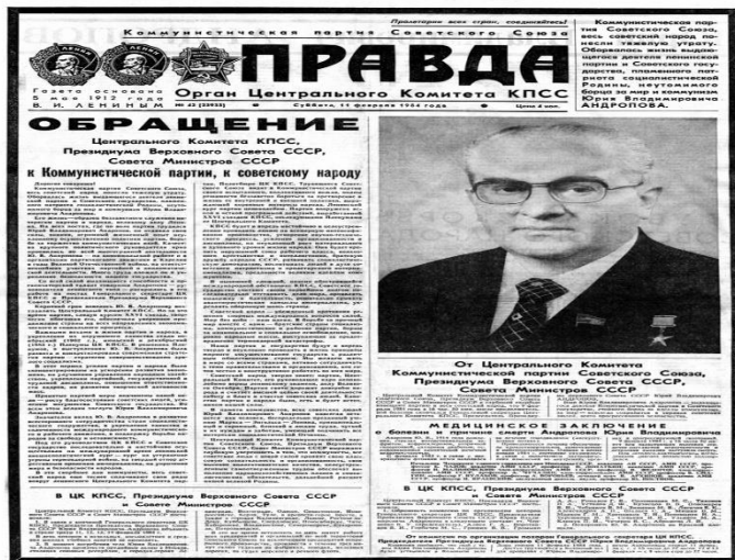
Рис. 1. Юрий Владимирович Андропов

Через два дня Пленум ЦК КПСС назначил Генеральным секретарем ЦК КПСС Ю. В. Андропова (рис. 1). Ему было 68 лет, и его биография была довольно характерной для представителя этого поколения: работа в комсомоле во время войны, потом назначение на должность инструктора ЦК. В центре внимания Андропов оказался во время венгерских событий 1956 г., поскольку за два года до этого стал послом в Будапеште. По воспоминаниям участников венгерских событий, роль советского посла действительно была неординарной и стала существенным фактором его последующей карьеры. В 1961 г. Андропов вернулся в ЦК, а с июня 1967 г. занимал 15 лет пост председателя КГБ СССР. Именно в эти годы роль и значение КГБ резко возросли. Усиление цензурного прессы, систематическая работа по выявлению и профилированию инакомыслящих в значительной степени отражали и личную позицию Андропова — последовательного сторонника ввода войск в Чехословакию и высылки Солженицына. После смерти Суслова в феврале 1982 г. Андропов стал главным идеологом партии, что и позволило ему в решительный момент оттеснить потенциального преемника Брежнева — Черненко, бессменного управделами ЦК.