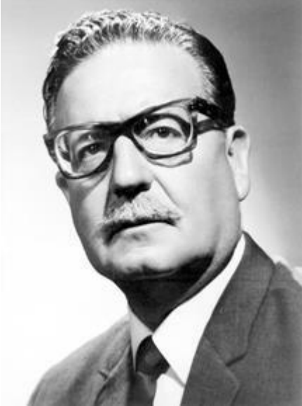
Рис. 10. С. Альенде – социалистический руководитель Чили

Чили, где С. Альенде (Рис. 10) начал демократические реформы, но потом власть захватил диктатор А. Пиночет (Рис. 11) при прямой поддержке США, и страна ушла из социалистического лагеря в капиталистический.