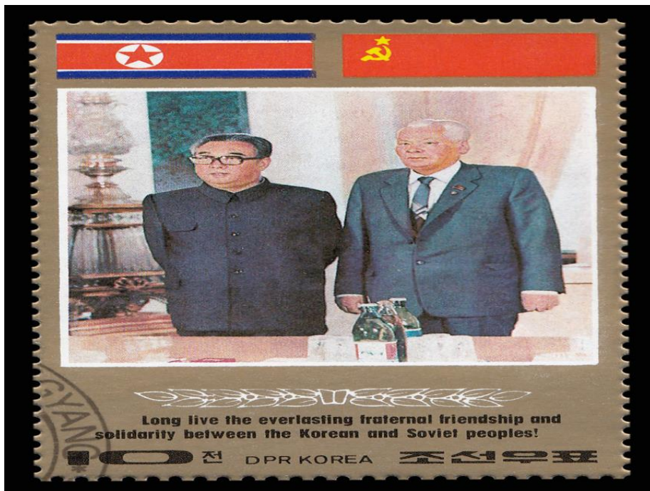
Рис. 2. Встреча Ким Ир Сена с К.У.

Общественная атмосфера с осени 1983 г. становилась всё более напряжённой в связи со слухами о тяжёлой болезни Андропова, его отсутствием на праздновании годовщины Октябрьской революции, пленуме ЦК. Слухи оправдались: 9 февраля 1984 г. Андропов умер.