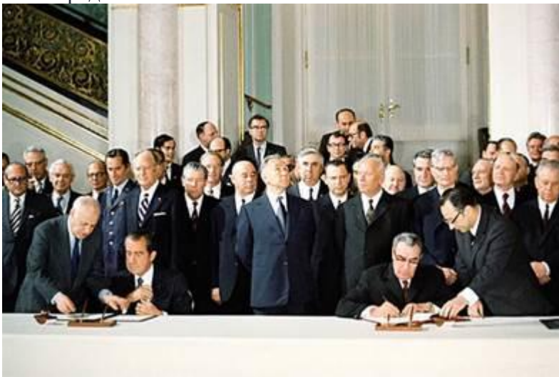
Рис. 3. Подписание ОСВ-1 Л.И. Брежневым и Р. Никсоном

Эпоху разрядки символизирует ряд международных договоров. Это договоры по ограничению стратегических вооружений между СССР и США – ОСВ-1 (Рис. 3) (1972 г.) и ОСВ-2 (Рис. 4) (1979 г.). Также это договор СССР и США 1973 г. о необходимости предотвращения ядерной войны. Было осуществлено несколько встреч между Л.И. Брежневым и главами американского государства (Л. Джонсон, Р. Никсон, Дж. Форд, Дж. Картер), причём эти встречи проходили как в Советском Союзе, так и за его пределами.