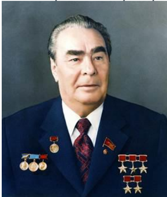
Рис. 2. Л.И. Брежнев – Генеральный секретарь ЦК КПСС СССР

Основные направления внешней политики СССР: