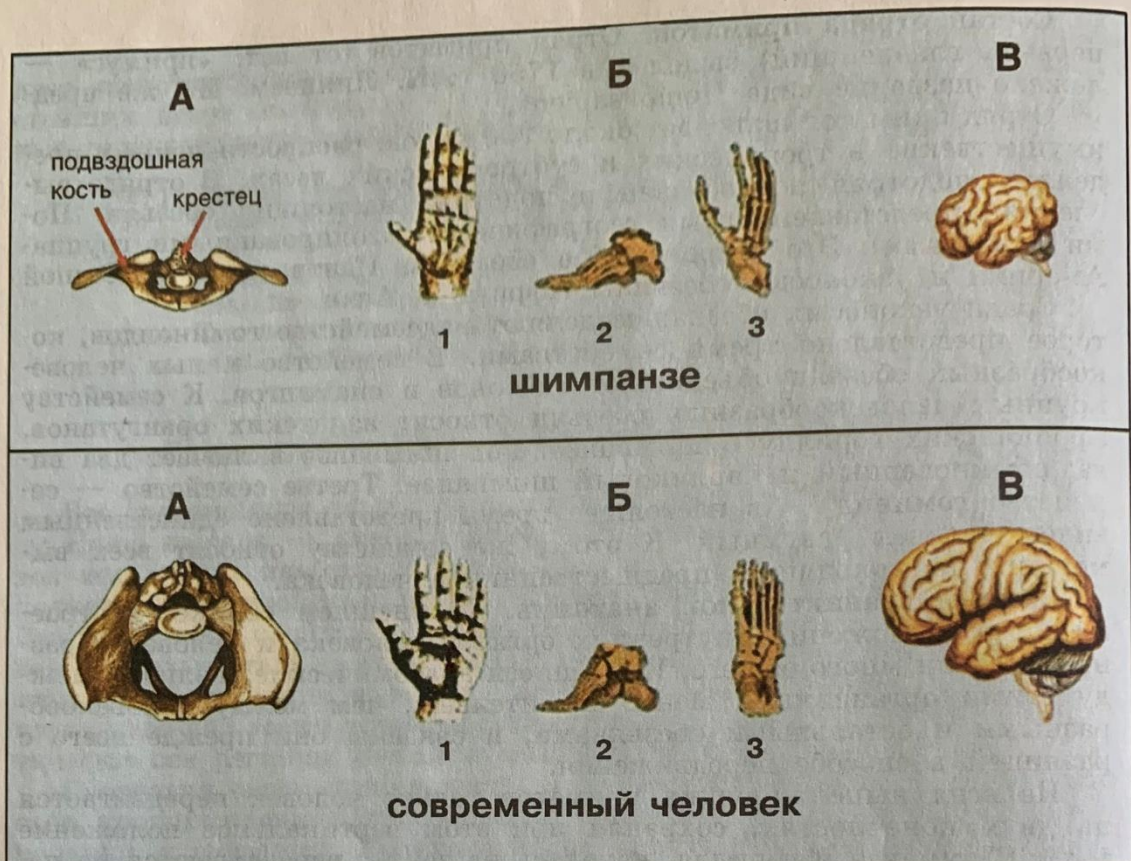
Рис. 90. Отличия в строении тела человека и шимпанзе.

А — поворот подвздошных костей таза; Б — изменения в строении кисти (1) и стопы (2, 3); В — изменения размеров и строения мозга