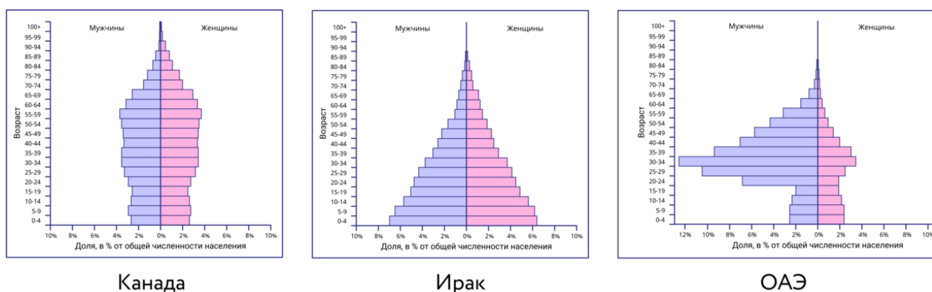
рисунок 2. - Половозрастные пирамиды

В половозрастных пирамидах находят отражение и крупные исторические события, оказавшие влияние на изменение численности населения, прежде всего войны.