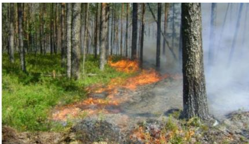
Рисунок 1 - Низовой лесной пожар

Наиболее часто в лесных массивах случаются низовые пожары, при которых выгорают лесная подстилка, подрост и подлесок, травянисто-кустарничковый покров, валежник, корневища деревьев и т.п. (рисунок 1). В засушливый период при ветре могут возникать верховые пожары, при которых огонь распространяется и по кронам деревьев, преимущественно хвойных пород. Скорость распространения низового пожара - от 0,1 до 3 м в минуту, а верхового - до 100 м в минуту по направлению ветра.