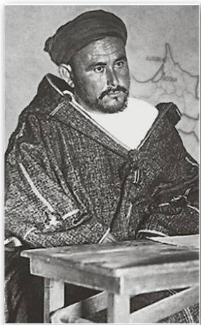
Абд аль-Керим возглавил освободительную борьбу рифов. 1926 г.

Особенностью национально-освободительного движения в Иране являлась борьба всех патриотических сил против влияния Великобритании и России (СССР) в стране. После оккупации территории Ирана английскими войсками (1918) началось вооруженное сопротивление интервентам. К власти в 1925 г. пришел Реза-шах , основатель новой шахской династии Пехлеви . После установления режима личной диктатуры шаха в стране начались реформы, направленные на модернизацию государства и консолидацию нации. Но постоянная борьба между сторонниками монархии и иранской буржуазией привела к тому, что в Иране усилилось влияние более развитых стран.