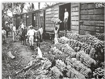
Работы по сбору бананов на предприятиях United Fruit Company в Гватемале. 1920-е гг.

Мировой экономический кризис привел к резкому сокращению спроса на сельскохозяйственную и сырьевую продукцию, падению национального производства, росту безработицы и понижению уровня жизни населения. В странах Латинской Америки обострились социальные противоречия. В Бразилии и на Кубе произошли революции, в Никарагуа развернулась партизанская борьба. С целью выхода из кризиса правящие круги латиноамериканских стран активизировали политику государственного регулирования. В это же время американский президент Ф. Рузвельт провозгласил в отношении Латинской Америки политику «доброго соседа», означавшую отказ США от интервенции в страны региона, то есть от прежней «политики большой дубинки».