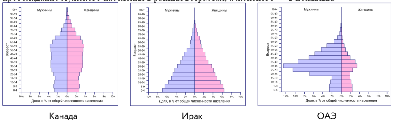
рисунок 2. - Половозрастные пирамиды

Для пирамиды развивающихся стран ( второй тип воспроизводства ), напротив, характерно очень широкое основание и узкий верх. Соотношение мужчин и женщин (левая и правая стороны пирамиды) не имеет столь существенных различий, однако заметно преобладание мужского населения в ранних возрастах, а женского — в пожилых.