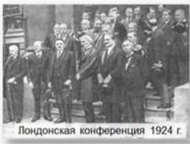
Лондонская конференция 1924 г.

Была объявлена всеобщая забастовка, прекращена выплата репараций. В ответ последовали карательные акции. Всего в столкновениях погибло 137 человек. Англия и США добились созыва в 1924 г. Лондонской конференции, которая смогла урегулировать этот вопрос. На конференции был утверждён план Дауэса, по которому Германия получала кредиты для восстановления экономики.