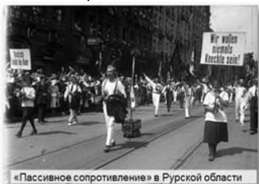
«Пассивное сопротивление» в Рурской области

В начале 1923 г. резко обострился «германский вопрос». В 1922 г. было принято решение, что в связи с тяжёлым экономическим положением Германия будет выплачивать репарации не деньгами, а товарами: сталью, древесиной, углём. Но в сентябре союзники заявили, что Веймарская республика умышленно затягивает поставки. В январе 1923 г. французские и бельгийские войска оккупировали Рурскую область. Здесь добывалось 72% угля и выплавлялось 50% чугуна и стали Германии. Оккупация вызвала взрыв народного негодования. По призыву рейхсканцлера Вильгельма Куно население Рура начало «пассивное сопротивление».