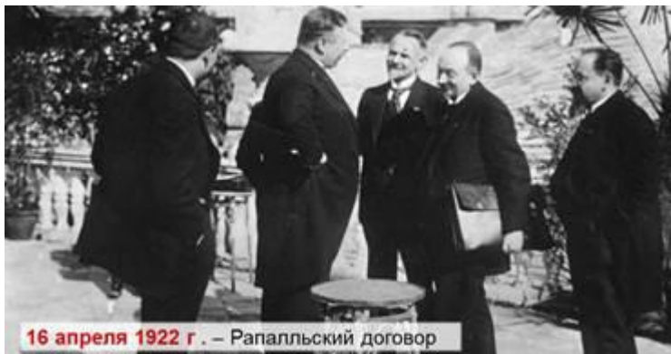
16 апреля 1922 г. – Рапалльский договор

Он предусматривал восстановление дипломатических отношений между Германией и РСФСР, взаимный отказ от финансовых претензий и развитие торгово-экономических отношений между странами. С 1924 г. началась «полоса дипломатического признания» СССР западными странами.