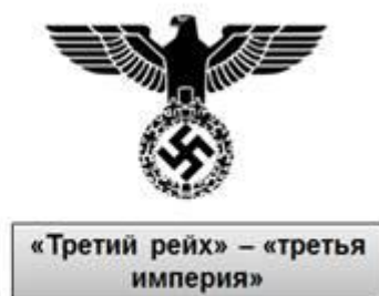
«Третий рейх» – «третья империя»

Первой была Священная Римская империя, а второй – Германская империя, созданная в 1871 г.