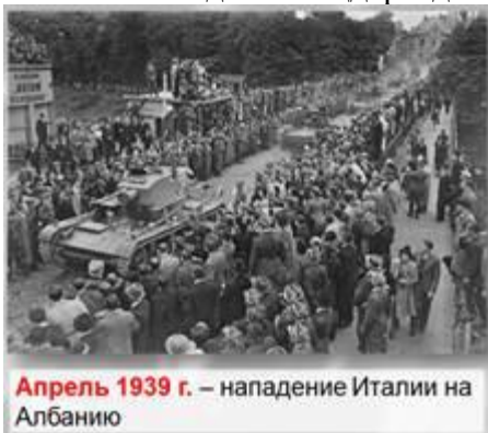
Апрель 1939 г. – нападение Италии на Албанию

Эфиопия оставалась практически единственной независимой страной в Северной Африке. Муссолини пока не собирался напрямую конфликтовать с европейскими владельцами африканских колоний. Война началась в октябре 1935 г. В мае 1936 итальянские войска захватили столицу страны – Аддис-Абебу. В апреле 1939 г. Италия начала вторжение в Албанию – самое слабое из государств Балканского полуострова, рассчитывая создать плацдарм для дальнейших захватов.