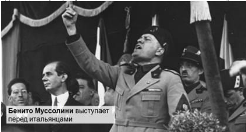
Бенито Муссолини выступает перед итальянцами

Третий очаг новой мировой войны был образован действиями Италии. Стремясь к господству в Средиземноморье, Муссолини начал создавать колониальную империю с захвата Эфиопии (Абиссинии).