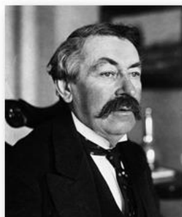
Аристид Бриан, министр иностранных дел Франции

В середине 1920-х гг. в Лиге Наций происходили переговоры по разоружению. Западные страны стремились создать систему договоров, которые могли бы предотвратить возможность возникновения войны. В 1928 г. министр иностранных дел Франции Аристид Бриан предложил государственному секретарю США Фрэнку Келлогу подписать между двумя странами договор об отказе от войны как средства национальной политики и предложить другим странам присоединиться к нему. Замечательная идея: если ни одна страна не начнёт военные действия первой, то все конфликты будут решаться в ходе переговоров. Пакт Бриана-Келлога подписали большинство стран, в том числе и СССР.