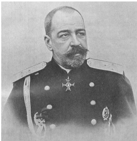
П. Д. Святополк-Мирский

Съезд провели нелегально. После этого в крупных городах России прошла так называемая «банкетная кампания»: в честь 40-летнего юбилея судебной реформы члены «Союза освобождения» устроили банкеты, на которых произносили политические речи, замаскированные под тосты. В них звучали открытые призывы к свержению самодержавия.