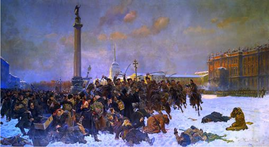
«Кровавое воскресенье». В. Коссак

Высказывалась версия, что Гапон сознательно спровоцировал столкновение между рабочими и властями. Он сумел скрыться и покинул Россию, позже примкнул к большевикам, затем к эсерам, а в конце 1905 г. вернулся на родину и попытался сотрудничать с полицией, за что его и повесили революционеры.