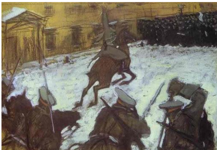
«Солдатушки, бравы ребятушки, где же ваша слава?». В. А. Серов. 1905

Как мы помним, некоторые партии считали наиболее эффективным методом реализации своих программ вооружённую борьбу. В декабре 1905 г. Петербургский совет рабочих депутатов готовился к организованному вооружённому выступлению. Его возглавил Лев Давидович Троцкий (1879–1940). В начале декабря Петербургский совет призвал население не платить налоги и забирать вклады из банков, за что на следующий день в полном составе был арестован.