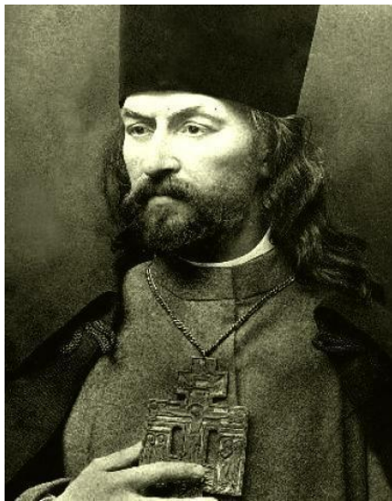
Г. А. Гапон

В декабре 1904 г. с Путиловского завода уволили нескольких рабочих. Они состояли в легальной организации «Собрание русских фабрично-заводских рабочих г. Санкт-Петербурга», которую поддерживала власть. Организацию возглавлял священник Георгий Аполлонович Гапон (1870–1906). Он обратился к руководству завода с просьбой восстановить уволенных, но получил отказ. В ответ 3 января 1905 г. рабочие Путиловского завода начали забастовку. Их поддержали на других заводах, и к 7 января стачка охватила весь город.