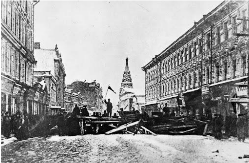
Баррикады во время Декабрьского восстания в Москве

очищено от баррикад, некоторые предприятия возобновили работу. Упорнее всего сражались около 700 революционеров на Пресне. Большинство домов в этом районе разрушила правительственная артиллерия. Окончательно восставшие признали поражение 19 декабря, после сдачи Прохоровской мануфактуры. Жертвами восстания стали более 400 человек, около 700 были ранены. В декабре 1906 г. восстания прокатились и по другим городам: Харькову, Нижнему Новгороду, Ростову-на-Дону. Все они были подавлены. После этого революция пошла на спад.