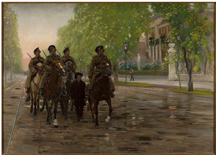
«Весна 1905 года». С. Масловский

12 мая началась забастовка в Иваново-Вознесенске. В ней приняли участие более 70 тыс. рабочих. Они создали первый общегородской Совет рабочих депутатов, половина из которых была большевиками.