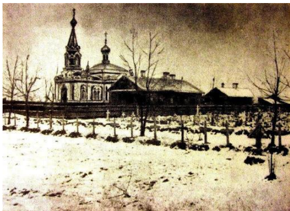
Могилы жертв Кровавого воскресенья на Преображенском кладбище под Санкт-Петербургом

По всей стране вспыхивали забастовки. Известно, что в первой половине 1905 г. в них приняли участие более 800 тыс. человек. На забастовках звучали политические требования. Волнения охватили западные и южные окраины страны: Польшу, Прибалтику, Грузию. В них участвовали крестьяне, которые силой отбирали у помещиков землю, инвентарь и скот. К протестам подключились студенты. Волнения происходили и в армии, но пока не массовые. Потрясением для консерваторов стало 4 февраля 1905 г.: от взрыва бомбы, которую подбросил эсер, погиб генерал-губернатор Москвы великий князь Сергей Александрович, дядя императора.