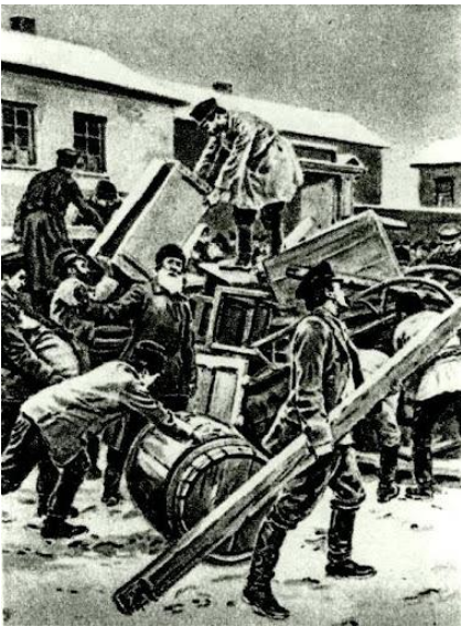
Баррикады на Васильевском острове. Рисунок Фрэнка Дадда. 1905

11 января 1905 г. генерал-губернатором Санкт-Петербурга был назначен Д. Ф. Трепов. Ему поручили подавить сопротивление восставших, которые устроили баррикады на Васильевском острове. По столице прокатились массовые аресты. 19 января Николай II принял в Царском Селе делегацию рабочих и сообщил, что прощает их за события 9 января. Император искренне считал, что этого достаточно, чтобы беспорядки прекратились.