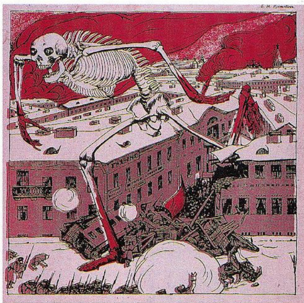
«Жупел революции». Б. М. Кустодиева

Вскоре после 17 октября Всероссийская политическая стачка закончилась. Эсеры распустили Боевую организацию. Но это вовсе не означало, что революция была окончена. 26 октября вспыхнуло восстание в Кронштадте, которое власти подавили через три дня. Петербургский Совет объявил забастовку в знак протеста. Правительство остановило производство на значительной части заводов. Совету пришлось отказаться от забастовки — рабочие остались без средств к существованию.