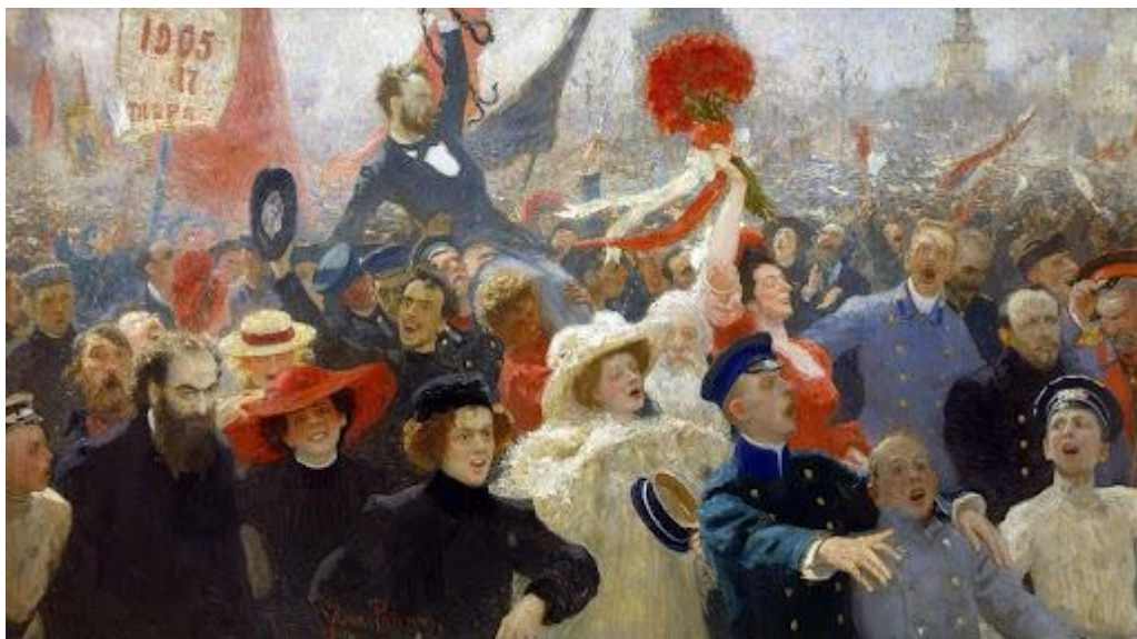
«17 октября 1905 года». И. Е. Репин

Председателем партии стал П. Н. Милуков. Её сторонниками были служащие, интеллигенция, земские либералы. Численность партии достигала 60 тыс. человек. Печатным органом кадетов стала газета «Речь».