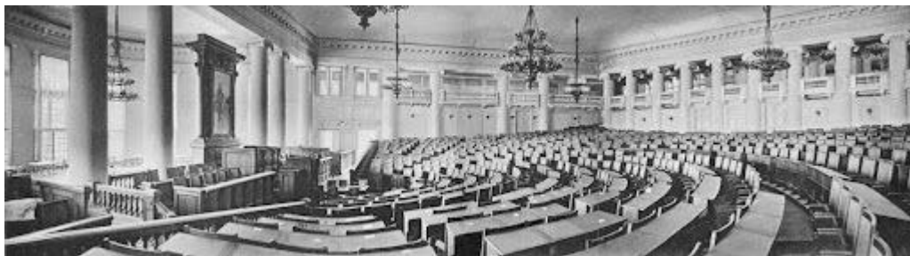
Зал заседаний Государственной думы в Таврическом дворце, Санкт-Петербург

были базовые права: неприкосновенность личности, жилища, свобода слова, собраний, союзов, возможность выезжать за границу. Однако разрешение на проведение собраний нужно было получать в полиции, а деятельность любого союза могла быть запрещена.