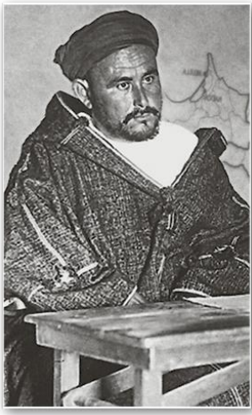
Абд аль-Керим возглавил освободительную борьбу рифов. 1926 г.

Особенностью национально-освободительного движения в Иране являлась борьба всех патриотических сил против влияния Великобритании и России (СССР) в стране. После оккупации территории Ирана английскими войсками (1918) началось вооруженное сопротивление интервентам. К власти в 1925 г. пришел Реза-шах , основатель новой шахской династии Пехлеви . После установления режима личной диктатуры шаха в стране начались реформы, направленные на модернизацию государства и консолидацию нации. Но постоянная борьба между сторонниками монархии и иранской буржуазией привела к тому, что в Иране усилилось влияние более развитых стран.