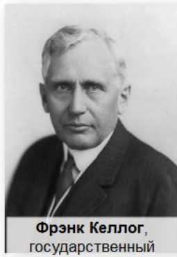
Фрэнк Келлог, государственный секретарь США

Пакт Бриана-Келлога (август 1928 г.) — отказ от войны как средства национальной политики.