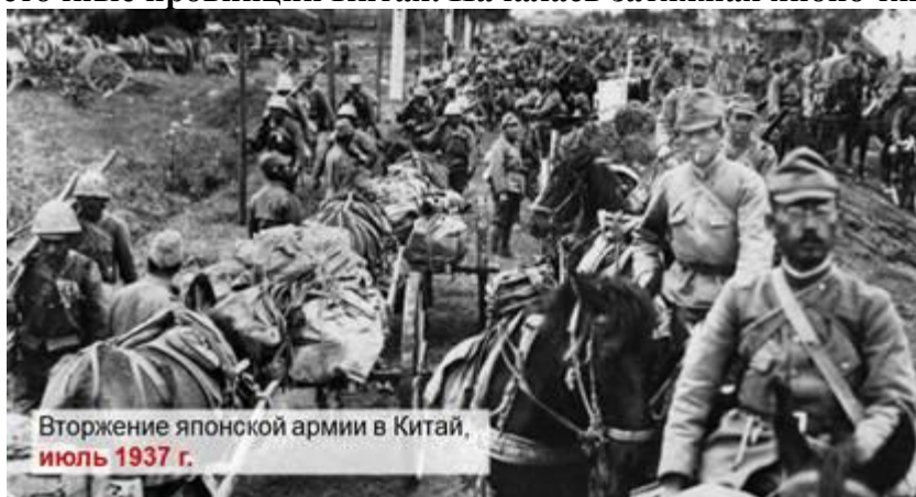
Вторжение японской армии в Китай, июль 1937 г.

Лига Наций, призванная бороться с агрессией, заняла половинчатую позицию. Япония агрессором не была объявлена, но на дальнейшие её действия в Китае был наложен запрет. В 1933 г. Япония вышла из Лиги Наций и начала открытую подготовку к войне. Летом 1937 г. японская армия вторглась в восточные провинции Китая. Началась затяжная японо-китайская война.