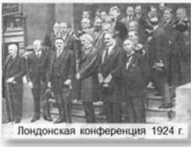
Лондонская конференция 1924 г.

Была объявлена всеобщая забастовка, прекращена выплата репараций. В ответ последовали карательные акции. Всего в столкновениях погибло 137 человек. Англия и США добились созыва в 1924 г. Лондонской конференции , которая смогла урегулировать этот вопрос. На конференции был утверждён план Дауэса , по которому Германия получала кредиты для восстановления экономики.