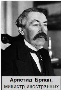
Аристид Бриан, министр иностранных дел Франции

Пакт Бриана-Келлога (август 1928 г.) — отказ от войны как средства национальной политики.