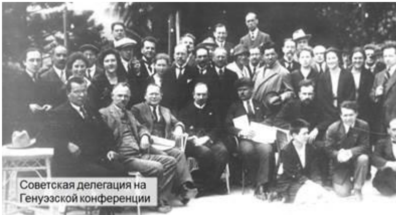
Советская делегация на Генуэзской конференции

На неё была приглашена и делегация Советской России. «Русский вопрос» стал основным на конференции. Речь шла о признании правительством РСФСР внешних долгов царской России и Временного правительства, а также о возвращении иностранным владельцам национализированной Советской властью. В ответ советская делегация потребовала возместить материальный ущерб от иностранной интервенции. Бурные дебаты завершились ничем. Компромисс не был достигнут. Однако именно в Генуе Советской России удалось прорвать ту дипломатическую изоляцию, в которой она оказалась.